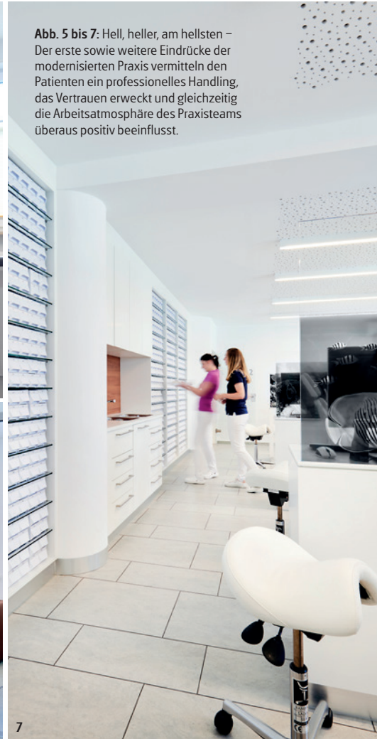
Abb. 5 bis 7: Hell, heller, am hellsten – Der erste sowie weitere Eindrücke der modernisierten Praxis vermitteln den Patienten ein professionelles Handling, das Vertrauen erweckt und gleichzeitig die Arbeitsatmosphäre des Praxisteams überaus positiv beeinflusst.

Möbel und Beleuchtung wurden erneuert, selbstverständlich erhielten die Wände einen frischen Anstrich und ein neues, freundliches und helles Praxisbild entstand.