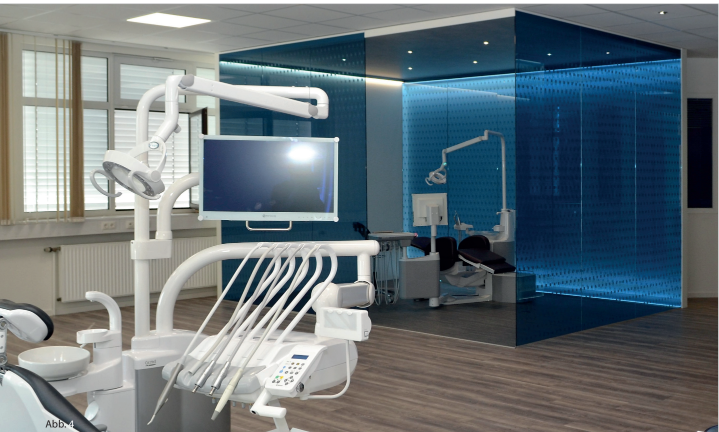
Abb. 4: Behandlungseinheiten perfekt in Szene gesetzt – die stylischen Präsentationsräumlichkeiten reihen sich in die Liste der exklusiven Belmont-Showrooms wie in London und Paris ein.

Berner Straße 18 60437 Frankfurt am Main Tel.: 069 506878-0 info@takara-belmont.de www.belmontdental.de