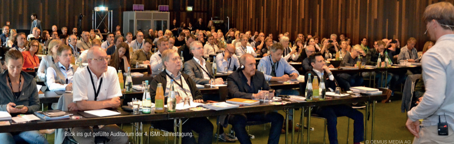
Blick ins gut gefüllte Auditorium der 4. ISMI-Jahrestagung.