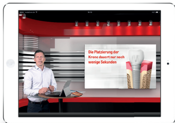
Als brandneues Produkt kommen jetzt die (Live-)Studio-Tutorials auf den Markt.

Mit zahlreichen Neuerungen, wie der CME-Fortbildung oder dem Live-streaming von Operationen, gewinnt ZWP online nach wie vor neue Nutzer. So hat z. B. die im Juni 2017 ins Leben gerufene ZWP online CME-Community inzwischen mehr als 2.600 angemeldete Mitglieder.