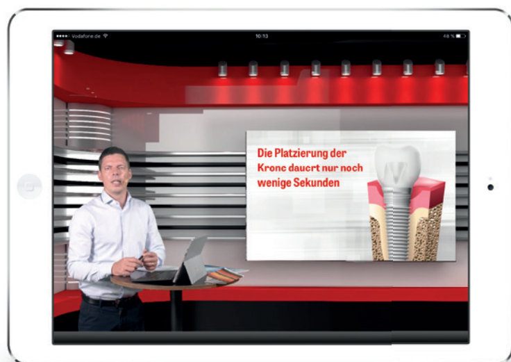
Als brandneues Produkt kommen jetzt die (Live-)Studio-Tutorials auf den Markt.

Mit zahlreichen Neuerungen, wie der CME-Fortbildung oder dem Livestreaming von Operationen, gewinnt ZWP online nach wie vor neue Nutzer. So hat z. B. die im Juni 2017 ins Leben gerufene ZWP online CME-Community inzwischen mehr als 2.600 angemeldete Mitglieder.