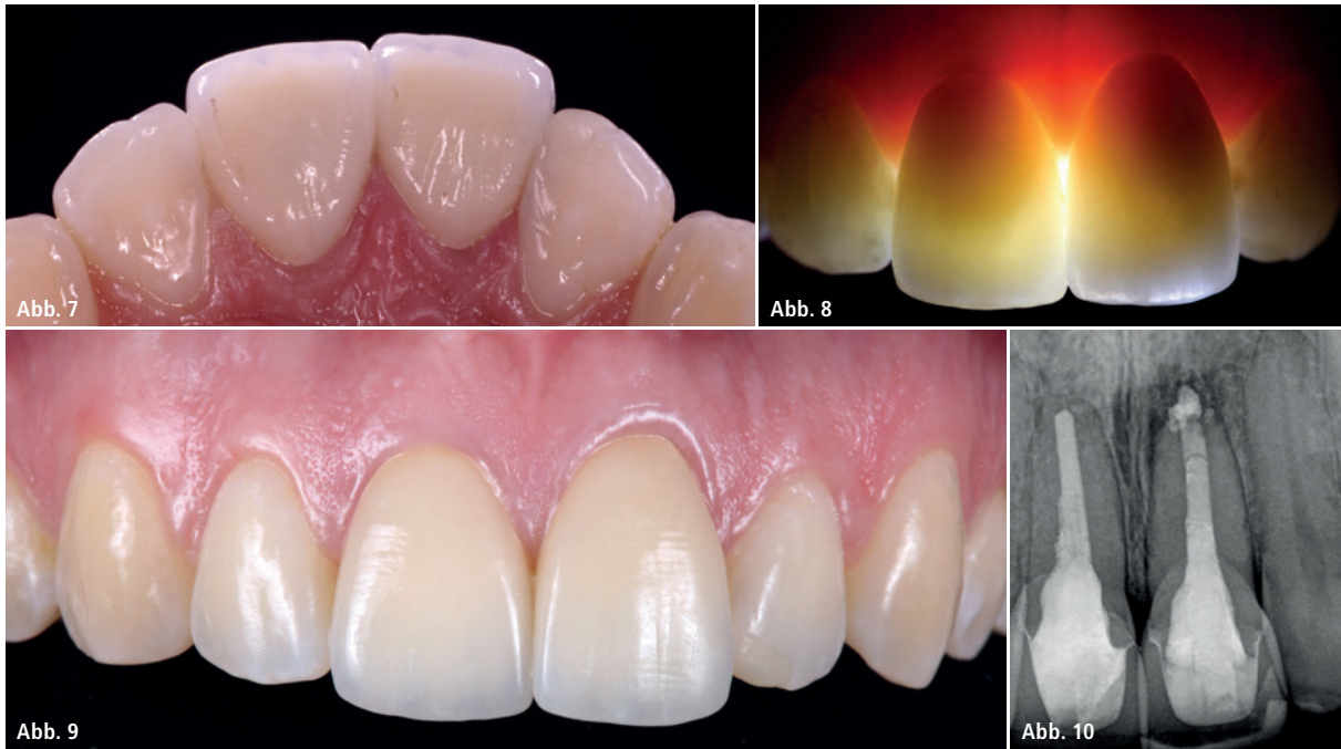
Abb. 7: Palatalansicht der Einprobe der Full-Veneers (360°, zirkuläre Veneers) aus Glaskeramik. Die darunter liegenden Pfeilerzähne konnten selbst bei minimaler Schichtstärke hervorragend maskiert werden. – Abb. 8: Durchlichtaufnahme der Oberkiefer-Frontzähne nach der Fertigstellung und Eingliederung. Durch die Kombination des DT Posts mit transluzenten Aufbaumaterialien und glaskeramischen Veneers konnte eine den natürlichen Zähnen entsprechende Lichttransmission erzielt werden. – Abb. 9: Nachuntersuchung sieben Jahre nach Eingliederung. Es zeigt sich auch nach sieben Jahren eine ästhetisch und funktionell höchst zufriedenstellende Situation (Zahntechniker: ZT Oliver Brix, Bad Homburg). – Abb. 10: Zahnfilmkontrollaufnahme nach siebenjähriger Tragedauer. Es zeigt sich eine dichte Struktur der Stiftverankerung sowie ein Überschuss des Wurzelfüllmaterials an Zahn 21.

des Aufbaus eingesetzt. Die minimal-invasive Präparation erfolgte unter Führung einer vom diagnostischen Wax-up abgeleiteten Schablone (Tiefziehfolie), die alle Informationen zur Korrektur der Fehlstellungen und zur Außenkontur der späteren definitiven Restaurationen enthielt (Abb. 6).