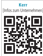
Kerr [Infos zum Unternehmen]

Die erfolgreiche Wurzelkanalfüllung ist einer der Schlüssel für den endodontischen Erfolg. Erst wenn das erreicht ist, können Zahnarzt und Patient sicher sein, dass Mikroorganismen davon abgehalten werden, wieder in das Wurzelkanalsystem einzudringen und dass im Zahn verbliebene Mikroorganismen von Nährstoffen der Gewebsflüssigkeit abgeschotet sind. 1 Für eine erfolgreiche Wurzelkanalfüllung bietet das elements™free-System von Kerr alle Vorteile des originalen elements-Systems, wie die Möglichkeiten des Downpack und Backfill – alles absolut kabellos. Weitere Vorteile sind ein schlanker, auf ergonomische Balance abgestimmter Look, intuitives Bedienungsfeld, Lithium-Ionen-Batterien, eine glatte Oberfläche sowie die Jump-Start-Funktion. Das System ist mit einem 360-Grad-Aktivierungsring für Präzision konzipiert, um Ihre Erfahrungen und das klinische Ergebnis zu vervollkommen, sowie mit einer digitalen Temperaturkontrolle für einen genauen Behandlungsablauf ausgestattet. Zusätzlich ist das Heizelement mit einer Aerogel-Isolierung für Ihren Komfort und die Patientensicherheit ummantelt. Als systembasierter Ansatz bietet elements™free einen Mikro-USB-Stecker für eine sichere Verbindung zur Ladestation sowie eine Sicherheits- und Transportverriegelung, um eine unabsichtliche Aktivierung zu verhindern.