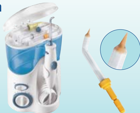
Waterpik Munddusche Ultra WP-100E (PZN 354578 6)

Weitere wissenschaftliche Informationen, Lieferprogramm und Kundenprospekte fordern Sie bitte direkt bei der intersanté GmbH an.