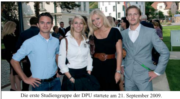
Die erste Studiengruppe der DPU startete am 21. September 2009.

Das Dental Excellence-Studium ist vom Österreichischen Akkreditierungsrat (ÖAR) akkreditiert, europaweit anerkannt, entspricht voll in allen Punkten den europäischen Bildungsrichtlinien. Mit besonders praxisorientierter Betreuung durch hoch angesehene Wissenschaftler, von 2.000 universitär weitergebildeten praktizierenden Zahnärzten/-innen evaluiert, wird höchster Bildungsanspruch erfüllt. Die Danube Private University (DPU) bildet junge Studierende zu exzellenten Zahnärzten/-innen aus, deren Praxen sich mit „State of the Art“ bei den Patienten auszeichnen. Außerdem bieten wir mit dem Bachelor/Master of Arts Medizinjournalismus