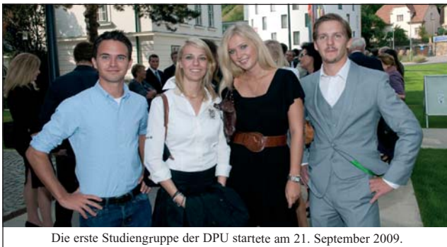
Die erste Studiengruppe der DPU startete am 21. September 2009.

Das Dental Excellence-Studium ist vom Österreichischen Akkreditierungsrat (ÖAR) akkreditiert, europaweit anerkannt, entspricht voll in allen Punkten den europäischen Bildungsrichtlinien. Mit besonders praxisorientierter Betreuung durch hoch angesehene Wissenschaftler, von 2.000 universitär weitergebildeten praktizierenden Zahnärzten/-innen evaluiert, wird höchster Bildungsanspruch erfüllt. Die Danube Private University (DPU) bildet junge Studierende zu exzellenten Zahnärzten/-innen aus, deren Praxen sich mit „State of the Art“ bei den Patienten auszeichnen. Außerdem bieten wir mit dem Bachelor/Master of Arts Medizinjournalismus