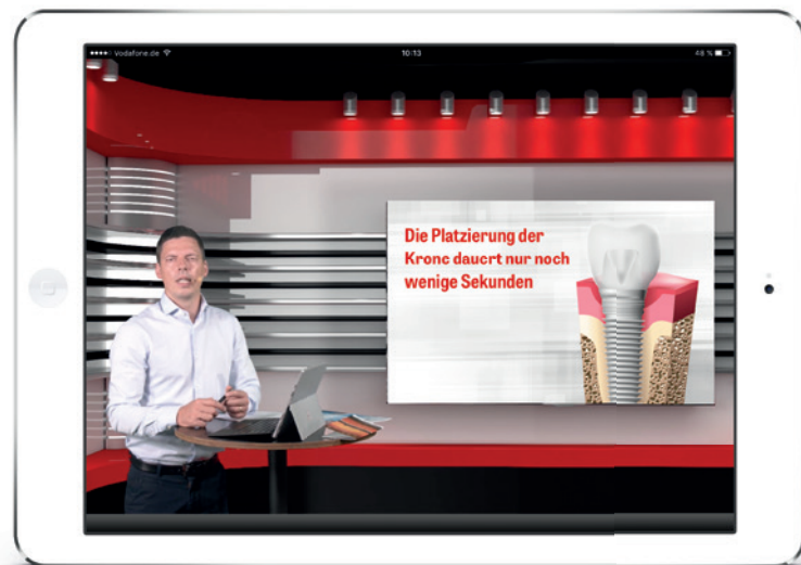
Als brandneues Produkt kommen jetzt die (Live-)Studio-Tutorials auf den Markt.