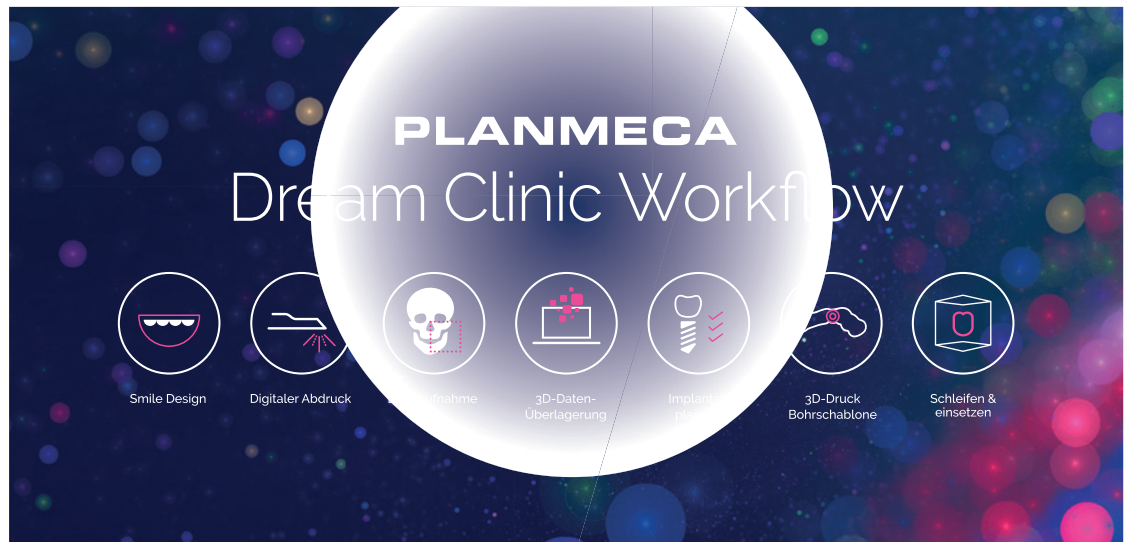
Planmeca Dream Clinic Workflow.

Herzstück ihrer Traumpraxis ist die etablierte All-in-one Softwareplattform Romexis von Planmeca. Alle Produkte aus den Segmenten Beratung, Bildgebung, Design und Fertigung werden in ihr gelungen zu einem vollständigen virtuellen Set-up integriert. So ist ein reibungsloser digitaler Workflow in der Zahnarztpraxis garantiert. Im Kontext des komplexen Patientenfalls sehen Messebesucher, wie komfortabel sich die Überlagerung von Bildgebungsdatensätzen und die prothetische Planung in der Software realisieren lassen.