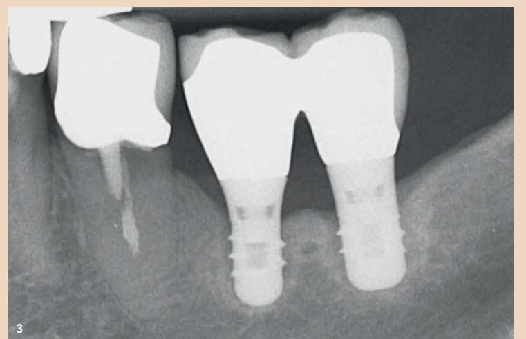
Abb. 3: Zwei desintegrierte Titanimplantate 20 Jahre nach Insertion. Die kurzen 6 mm-Implantate wurden damals verblockt. Beide Implantate zeigen eine dünne Aufhellung entlang des Implantat-Knochen-Interfaces. Beide Implantate zeigten während 20 Jahren nie Anzeichen einer periimplantären Infektion.

Es gibt nicht den einen Fehler, den man am häufigsten sieht. Die meisten Fehler werden aber klar bei der Implantatchirurgie gemacht. Diese Fehler verursachen die meisten ästhetischen Misserfolge und sie sind oft auch die Ursache für die dargelegten Implantatinfektionen. Die gefühlte steigende Zahl von solchen Komplikationen wird dadurch begünstigt, dass chirurgisch unqualifizierte Zahnärzte Implantatoperationen durchführen, denen es entweder an der nötigen chirurgischen Ausbildung fehlt und/oder an der notwendigen implantatchirurgischen Erfahrung. Schlimm ist es, wenn beides kombiniert auftritt.