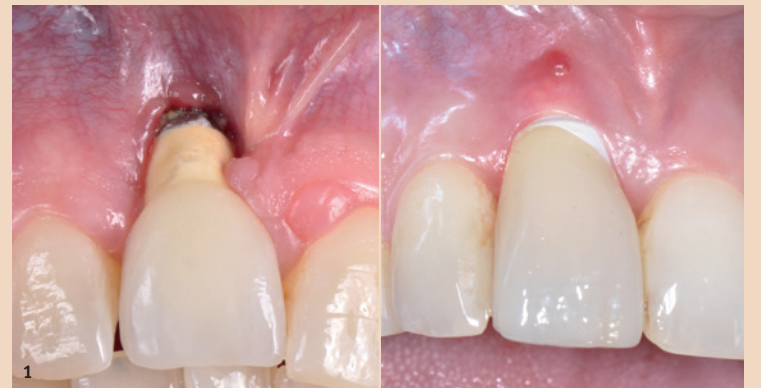
Abb. 1: Ästhetische Misserfolge infolge zu bukkaler Implantatinserterion. Links ein Titanimplantat, rechts ein Zirkonimplantat. Die faciale Fehlposition hat bei beiden Implantaten zur typischen Mukosarezession geführt, welche die Patienten enorm stört. Bei beiden muss das Implantat entfernt werden, um das Problem zu beheben.

Um eine Implantatinfektion in der Häufigkeit zu reduzieren, ist eine regelmäßige Betreuung des Patienten durch eine Dentalhygienikerin notwendig, wobei das Intervall auf das Risikoprofil des Patienten abgestimmt werden muss. Tritt eine Infektion auf, in der Frühform eine Mukositis, später eine Periimplantitis, muss diese therapiert werden. Dann empfiehlt es sich, das Betreuungsintervall zu verkürzen und die tägliche