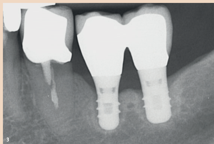
Abb. 3: Zwei desintegrierte Titanimplantate 20 Jahre nach Insertion. Die kurzen 6 mm-Implantate wurden damals verblockt. Beide Implantate zeigen eine dünne Aufhellung entlang des Implantat-Knochen-Interfaces. Beide Implantate zeigten während 20 Jahren nie Anzeichen einer periimplantären Infektion.

Es gibt nicht den einen Fehler, den man am häufigsten sieht. Die meisten Fehler werden aber klar bei der Implantatchirurgie gemacht. Diese Fehler verursachen die meisten ästhetischen Misserfolge und sie sind oft auch die Ursache für die dargelegten Implantatinfektionen. Die gefühlte steigende Zahl von solchen Komplikationen wird dadurch begünstigt, dass chirurgisch unqualifizierte Zahnärzte Implantatoperationen durchführen, denen es entweder an der nötigen chirurgischen Ausbildung fehlt und/oder an der notwendigen implantatchirurgischen Erfahrung. Schlimm ist es, wenn beides kombiniert auftritt.