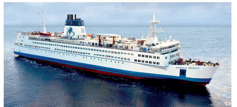
Die MS „Africa Mercy“ ist jährlich zur Wartung und Montage im Hafen von Gran Canaria im Trockendock.