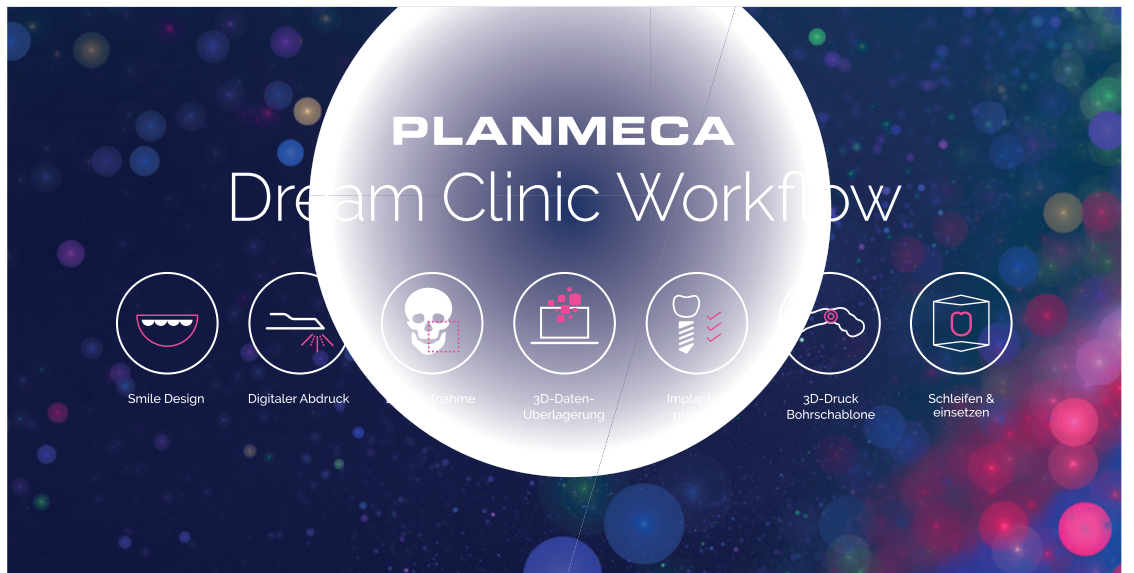
Planmeca Dream Clinic Workflow.

Herzstück ihrer Traumpraxis ist die etablierte All-in-one Softwareplattform Romexis von Planmeca. Alle Produkte aus den Segmenten Beratung, Bildgebung, Design und Fertigung werden in ihr gelungen zu einem vollständigen virtuellen Set-up integriert. So ist ein reibungsloser digitaler Workflow in der Zahnarztpraxis garantiert. Im Kontext des komplexen Patientenfalls sehen Messebesucher, wie komfortabel sich die Überlagerung von Bildgebungsdatensätzen und die prothetische Planung in der Software realisieren lassen.