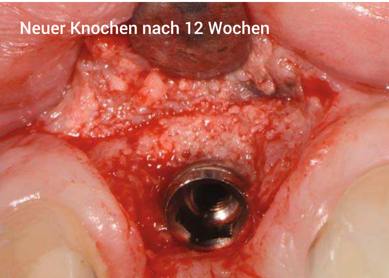
Neuer Knochen nach 12 Wochen