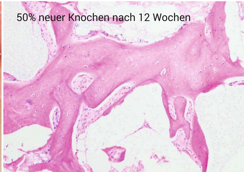
50% neuer Knochen nach 12 Wochen