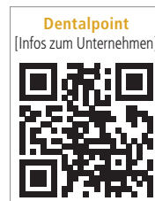
Dentalpoint [Infos zum Unternehmen]

wissenschaftlichen Update zum Thema Keramikimplantate sowie der Vorstellung des zweiteiligen Implantatsystems ZERAMEX® XT wird in der anschließenden Live-OP der genaue Umgang und die Insertion dieser Implantate demonstriert. Aufkommende Fragen werden direkt im Anschluss an die OP von den Referenten in einer offenen Diskussionsrunde beantwortet. Den direkten Umgang mit Keramikimplantaten können die Teilnehmer im prothetischen Hands-on-Workshop erproben. Es werden sechs Fortbildungspunkte vergeben. Die Teilnehmerplätze sind limitiert. Die Anmeldung und alle Informationen zur Fortbildung gibt es auf der Website.