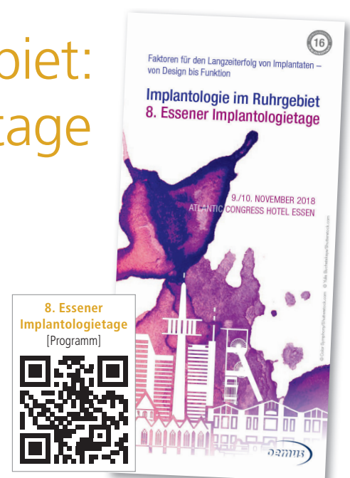
8. Essener Implantologietage [Programm]

Das hochkarätige Referententeam mit ausgewiesenen Experten von Universitäten und aus der Praxis sowie die spannenden Vortragsthemen werden Garant für ein erstklassiges Fortbildungserlebnis sein. Der Pre-Congress mit verschiedenen Seminaren zu den Themen Parodontologie, Endodontie, Implantatchirurgie und Notfallmanagement in der Zahnarztpraxis sowie das begleitende Programm für das Praxisteam schaffen zugleich die Möglichkeit,