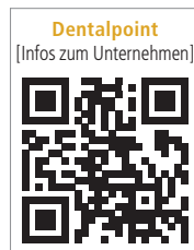
Dentalpoint [Infos zum Unternehmen]

wissenschaftlichen Update zum Thema Keramikimplantate sowie der Vorstellung des zweiteiligen Implantatsystems ZERAMEX® XT wird in der anschließenden Live-OP der genaue Umgang und die Insertion dieser Implantate demonstriert. Aufkommende Fragen werden direkt im Anschluss an die OP von den Referenten in einer offenen Diskussionsrunde beantwortet. Den direkten Umgang mit Keramikimplantaten können die Teilnehmer im prothetischen Hands-on-Workshop erproben. Es werden sechs Fortbildungspunkte vergeben. Die Teilnehmerplätze sind limitiert. Die Anmeldung und alle Informationen zur Fortbildung gibt es auf der Website.