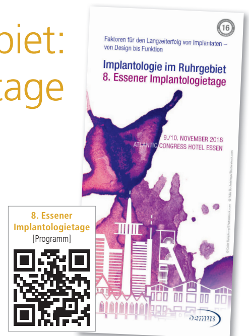
8. Essener Implantologietage [Programm]

Das hochkarätige Referententeam mit ausgewiesenen Experten von Universitäten und aus der Praxis sowie die spannenden Vortragsthemen werden Garant für ein erstklassiges Fortbildungserlebnis sein. Der Pre-Congress mit verschiedenen Seminaren zu den Themen Parodontologie, Endodontie, Implantatchirurgie und Notfallmanagement in der Zahnarztpraxis sowie das begleitende Programm für das Praxisteam schaffen zugleich die Möglichkeit,