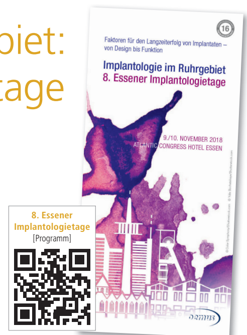
8. Essener Implantologietage [Programm]

Das hochkarätige Referententeam mit ausgewiesenen Experten von Universitäten und aus der Praxis sowie die spannenden Vortragsthemen werden Garant für ein erstklassiges Fortbildungserlebnis sein. Der Pre-Congress mit verschiedenen Seminaren zu den Themen Parodontologie, Endodontie, Implantatchirurgie und Notfallmanagement in der Zahnarztpraxis sowie das begleitende Programm für das Praxisteam schaffen zugleich die Möglichkeit,