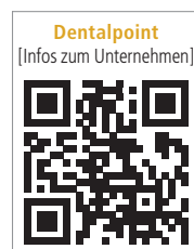
Dentalpoint [Infos zum Unternehmen]

wissenschaftlichen Update zum Thema Keramikimplantate sowie der Vorstellung des zweiteiligen Implantatsystems ZERAMEX® XT wird in der anschließenden Live-OP der genaue Umgang und die Insertion dieser Implantate demonstriert. Aufkommende Fragen werden direkt im Anschluss an die OP von den Referenten in einer offenen Diskussionsrunde beantwortet. Den direkten Umgang mit Keramikimplantaten können die Teilnehmer im prothetischen Hands-on-Workshop erproben. Es werden sechs Fortbildungspunkte vergeben. Die Teilnehmerplätze sind limitiert. Die Anmeldung und alle Informationen zur Fortbildung gibt es auf der Website.