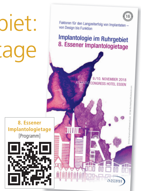
8. Essener Implantologietage [Programm]

Das hochkarätige Referententeam mit ausgewiesenen Experten von Universitäten und aus der Praxis sowie die spannenden Vortragsthemen werden Garant für ein erstklassiges Fortbildungserlebnis sein. Der Pre-Congress mit verschiedenen Seminaren zu den Themen Parodontologie, Endodontie, Implantatchirurgie und Notfallmanagement in der Zahnarztpraxis sowie das begleitende Programm für das Praxisteam schaffen zugleich die Möglichkeit,