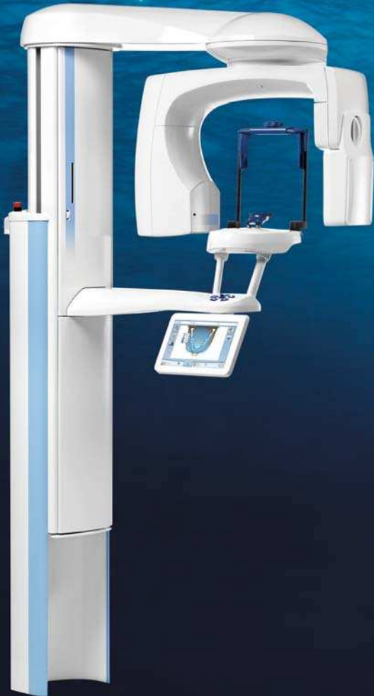
Ohne Planmeca CALM™