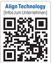
Align Technology [Infos zum Unternehmen]

Align Technology GmbH Tel.: 0800 2524990 www.invisalign.de