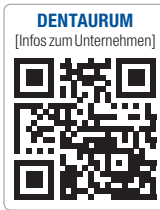
DENTAURUM [Infos zum Unternehmen]