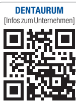
DENTAURUM [Infos zum Unternehmen]