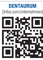
DENTAURUM [Infos zum Unternehmen]