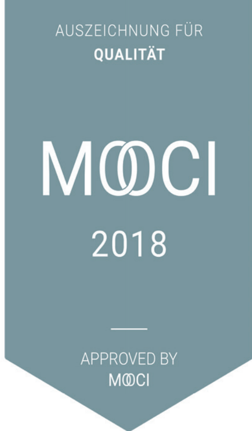
Abb. 1: Das Gütesiegel von MOOCI wird nur an Ärzte vergeben, die den strengen Prüfprozess des Portals bestehen.

Anfrageprozess direkt mit den Ärzten in Verbindung treten und einen ersten Kontakt herstellen. So soll die gleiche Emotion beim Patienten entstehen, als würde er dem Arzt persönlich gegenüber sitzen.