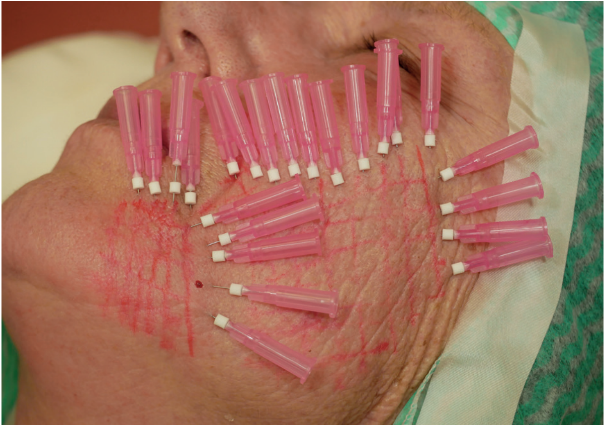
Abb. 3: Fadenlifting mit Monofäden.

in der Haut verschwindet. Eine leichte Massage der Einstichstelle ist dabei ebenfalls hilfreich.