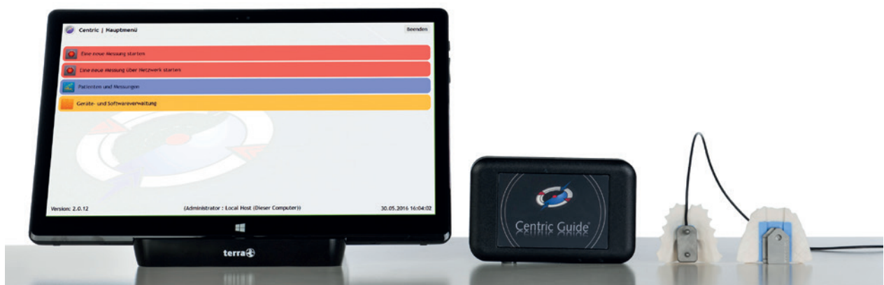
Abb. 1: Centric Guide System.

Heutzutage geht es, neben der alltäglichen zahntechnischen Arbeit, um Laborausrichtung und Positionierung. Mit welchen Leistungen können Kunden, sprich Zahnärzte, begeistert werden? Wie können neue Kunden für das Dentallabor gewonnen werden usw.? Mitunter geht es auch um die reine Existenz des Dentallabors. Dabei kann man schnell den Eindruck gewinnen, dass es nur noch zwei Gruppen von Dentallaboren gibt. Die einen, die so viel Arbeit haben und ständig auf der Suche nach guten Zahntechnikern sind, und denen, die zu wenig Arbeit haben und auf der Suche nach guten Kunden sind.