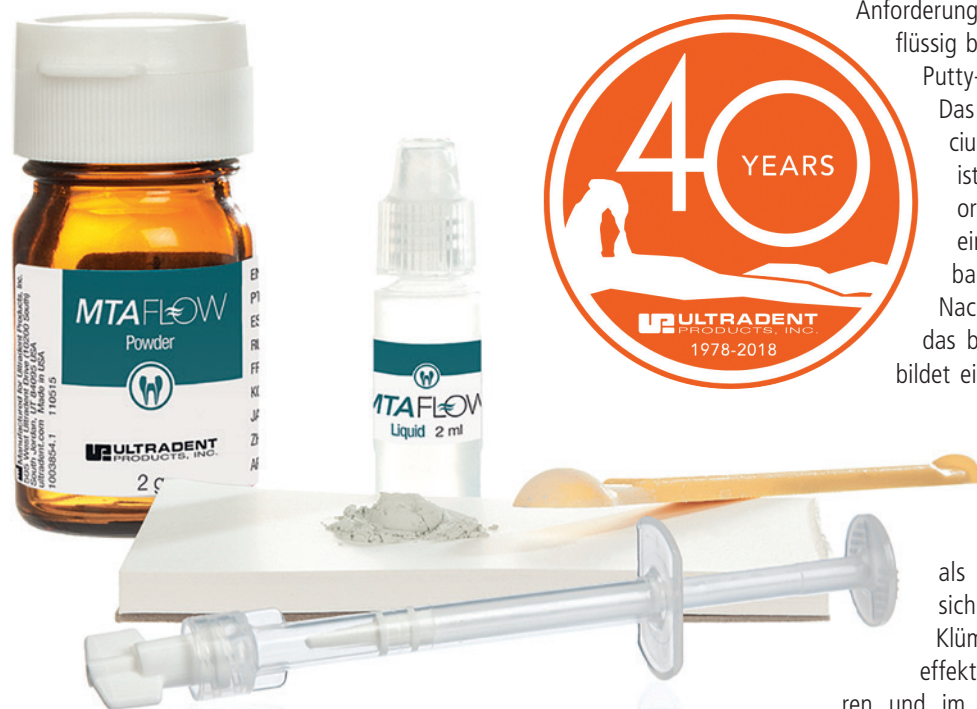
Abb. 1: Das Mischungsverhältnis von MTAFlow™ kann den verschiedenen Behandlungszwecken angepasst werden. Das äußerst feinkörnige Pulver ergibt gemeinsam mit dem patentierten Gelmedium eine allzeit glatte Konsistenz.

Aufgrund der geringen Partikelgröße von weniger als zehn Mikrometern lässt sich MTAFlow™ ganz ohne Klümpchenbildung homogen, effektiv sowie leicht applizieren und im Wurzelkanal platzieren. Nach fünf Minuten kann der Reparaturzement zur direkten weiteren Verarbeitung abgespült oder luftgetrocknet