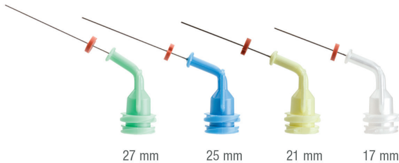
Abb. 2: Kein anderer MTA-Zement kann wie der MTAFlow™ in dünnflüssigem Zustand mit den NaviTip® 29 ga-Spitzen appliziert werden.

werden, ohne dabei auszuwaschen. Grundlegend macht die patentierte Gelformulierung den Reparaturzement deutlich resistenter gegen Auswascheffekte als andere mit Wasser angemischte MTA-Produkte.