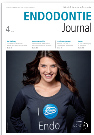
Titelbild: Komet Dental/Gebr. Brasseler GmbH & Co. KG