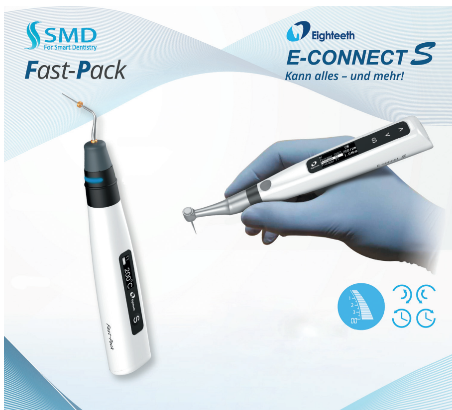
Abb. 2: Der E-connect S (r.) und das neue Fast-Pack Down-Pack-Instrument.

zahnärzten und Endo-Spezialisten gleichermaßen erfüllt. Das Unternehmen bietet ein vollständiges Sortiment von individuellen kabellosen Endodontie-Geräten sowie ein komplettes Endodontie-Konzept an – wie sein neues „e-concept“-System. Kein anderer Marktteilnehmer kann gegenwärtig ein so umfangreiches Sortiment an Geräten zur Verfügung stellen, das die umfassenden Anforderungen von Endodontie-Spezialisten und Allgemeinzahnärzten bei einem so guten Preis-Leistungs-Verhältnis erfüllen kann. Erst vor Kurzem kündigte das Unternehmen seinen neuen innovativen Endo-Motor, den „E-connect S“, an und führte sein neues Down-Pack-Gerät „Fast-Pack“ ein. Alle Produkte zeichnen sich durch einzigartige Funktionen und ein hervorragendes Preis-Leistungs-Verhältnis aus. Der „E-connect S“-Endo-Motor ist mit allen gängigen Feilensystemen kompatibel. Er ist mit einer Bibliothek von 26 werkseitig eingestellten Systemen und elf zusätzlichen Programmen für die Selbstprogrammierung ausgestattet. Der Motor hat einen integrierten Apex-Lokator und einen unabhängigen Apex-Lokator, ein ATC-Sicherheitssystem zur Drehmomentkontrolle und kann