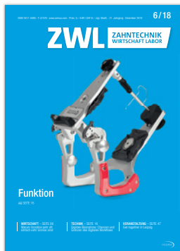
Arto XP – die neue Artikulator-Serie von Baumann Dental

Bezugspreis: Einzelheft 5,- Euro ab Verlag zzgl. gesetzl. MwSt. Jahresabonnement im Inland 36,- Euro ab Verlag inkl. gesetzl. MwSt. und Versandkosten. Kündigung des Abonnements ist schriftlich 6 Wochen vor Ende des Bezugszeitraums möglich. Abonnementgelder werden jährlich im Voraus in Rechnung gestellt. Der Abonnent kann seine Abonnementbestellung innerhalb von 2 Wochen nach Absenden der Bestellung schriftlich bei der Abonnementverwaltung widerrufen. Zur Fristwahrung genügt die rechtzeitige Absendung des Widerrufs (Datum des Poststempels). Das Abonnement verlängert sich zu den jeweils gültigen Bestimmungen um ein Jahr, wenn es nicht 6 Wochen vor Jahresende gekündigt wurde.