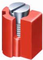
Höhe 2,9 mm Breite 2,7 mm

kein Bohren, kein Kleben, einfach nur schrauben - 100.000fach verarbeitet