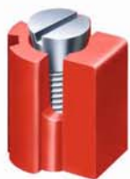
Höhe 2,9 mm Breite 2,7 mm

kein Bohren, kein Kleben, einfach nur schrauben - 100.000fach verarbeitet