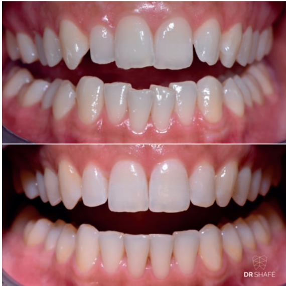
Dr. Shafé: Ein wunderschönes Invisalign Go-Behandlungsergebnis nach 3,5 Monaten Behandlungszeit.

Ich habe Anfang Juli 2016 meine Praxis in Berlin-Charlottenburg eröffnet. Direkt danach habe ich angefangen, Bilder auf Instagram zu posten, von unseren neuen Praxisräumlichkeiten, unserem Equipment, von mir in der Praxis und meinem Praxisteam. Gleichzeitig habe ich im Praxisalltag immer wieder Vorher-Nachher-Aufnahmen mit der Intraoralkamera von Versorgungen gemacht, um Patienten den Weg zur finalen Fassung besser erklären und visualisieren zu können, und dann habe ich auch solche Bilder, zum Beispiel von einer erfolgreichen Alignertherapie, auf Instagram gestellt. Ich wollte zeigen, wo und wer wir sind und was wir machen und so, gerade um bei Patienten, die nicht gerne zum Zahnarzt gehen, die Hemmschwelle runterzufahren und die Kontaktaufnahme zu erleichtern.