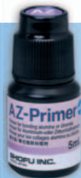
6-MHPA-Monomer im AZ-Primer