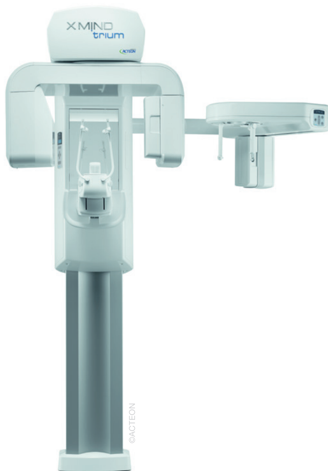
Abb. 1: Das ACTEON-Panoramabildgebungssystem X-mind trium kann mit der DVT- und Fernröntgenfunktion erweitert werden.

Mit langjähriger Erfahrung, Expertenwissen, Gespür für Innovationen und fortwährendem Interesse an den Wünschen von Zahnärzten kreiert und entwickelt die ACTEON®-Gruppe hochmoderne Medizinprodukte, die nicht nur Behandlungsprotokolle vereinfachen, digitalen Workflow fördern oder sich optimal in die Praxisausstattung integrieren lassen. Stets ist es ACTEON ein Anliegen, mit seinem Know-how zeitgemäß minimalinvasive und atraumatische Behandlungen zu ermöglichen.