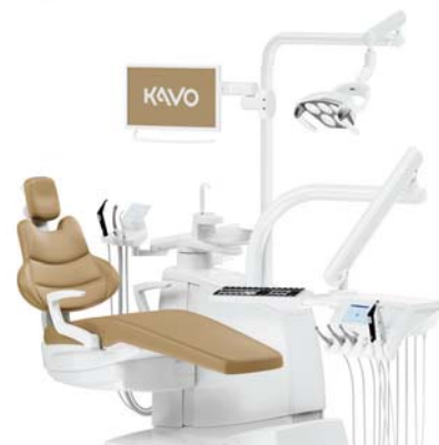
KaVo ESTETICA™ E70/E80 Vision

Unser IDS-Messehighlight ab sofort bestellen und gleich liefern lassen: die KaVo ESTETICA™ E80 Vision jetzt zum Preis einer KaVo ESTETICA™ E70 Vision! Neben dem ergonomischen Schwebestuhlkonzept, Arztelement mit Touchdisplay und Hygiene-Center jetzt auch inklusive motorischer Horizontalverschiebung und Sitzbankanhebung sowie motorischem Mundspülbecken.