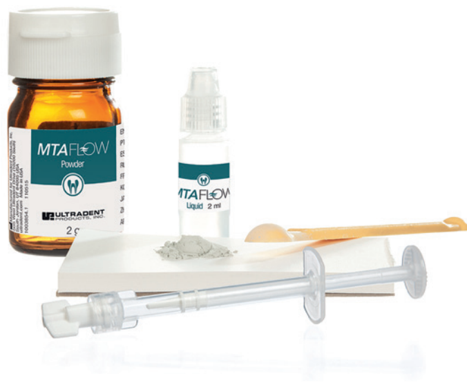
Endo-Eze™ MTAFlow™ kombiniert ein sehr feinkörniges, bioaktives Pulver mit einem Flüssigkeits-Gel-Gemisch. Das Produkt lässt sich je nach Anforderung flexibel anmischen und ergibt eine allzeit glatte Konsistenz.

Zahnarzt Markus Ludolph nutzt das Produkt seit Anbeginn in seiner Dortmunder Praxis. Im Gespräch beschreibt er seine Beweggründe und Erfahrungen.