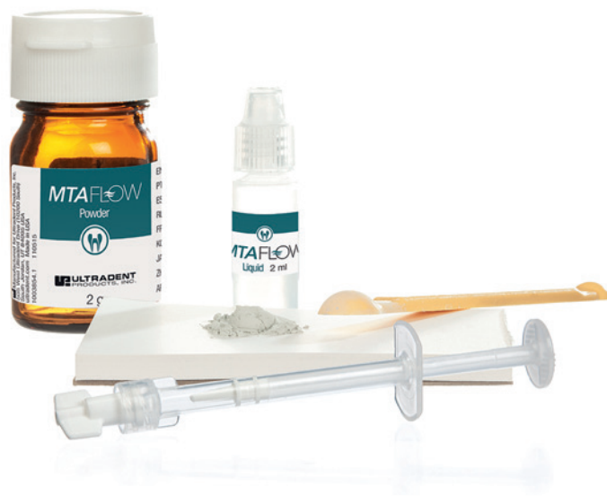
Endo-Eze™ MTAFlow™ kombiniert ein sehr feinkörniges, bioaktives Pulver mit einem Flüssigkeits-Gel-Gemisch. Das Produkt lässt sich je nach Anforderung flexibel anmischen und ergibt eine allzeit glatte Konsistenz.

Zahnarzt Markus Ludolph nutzt das Produkt seit Anbeginn in seiner Dortmunder Praxis. Im Gespräch beschreibt er seine Beweggründe und Erfahrungen.