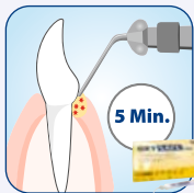
Direkte Applikation in die Zahnfleischtasche