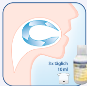
Fortsetzung der Behandlung durch den Patienten zuhause