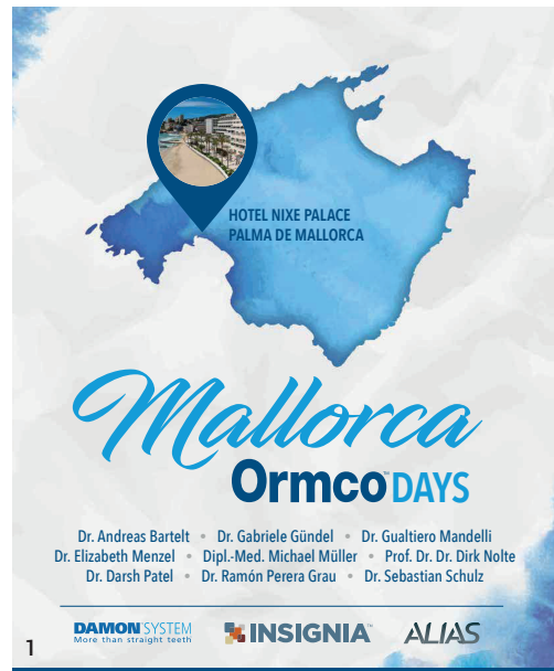
Abb. 1 und 2: Veranstaltungsort der vom 3. bis 5. Oktober stattfindenden Mallorca Ormco Days 2019 ist das direkt am Meer gelegene Hotel Nixe Palace in Palma. Abb. 3: Neun international namhafte Referenten informieren drei Tage lang über aktuelle Trends des Fachbereichs.

Anfang Oktober 2019 können sich Kieferorthopäden auf ein Fachevent der Spitzenklasse freuen. Neun international namhafte Referenten informieren drei Tage lang über aktuelle Trends des Fachbereichs. Eine Top-Location sowie ein großartiges Rahmenprogramm sorgen darüber hinaus für unvergessliche Momente.