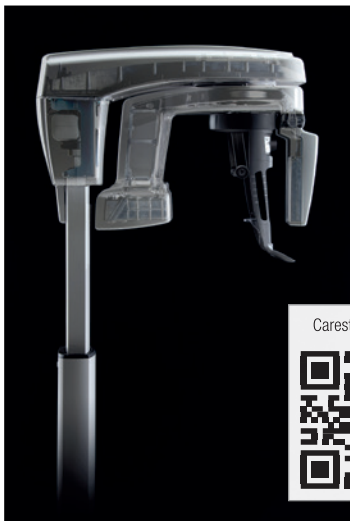
Das CS 8100 3D bietet mit seiner dreidimensionalen Bildgebung die bestmögliche Ansicht der Patientenanatomie.

Digitale Lösungen von Carestream Dental.