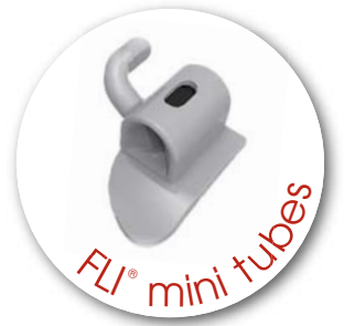
FLI® mini tubes