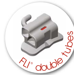
FLI® double tubes