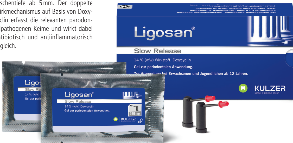
Abb. 1: Das Lokalantibiotikum Ligosan® Slow Release ist seit fast einem Jahrzehnt eine wertvolle Ergänzung in der Reduktion von Taschentiefen bei der Parodontaltherapie.

Im Ergebnis der ergänzenden Therapie mit Ligosan® Slow Release ist nach sechs Monaten eine höhere Re-