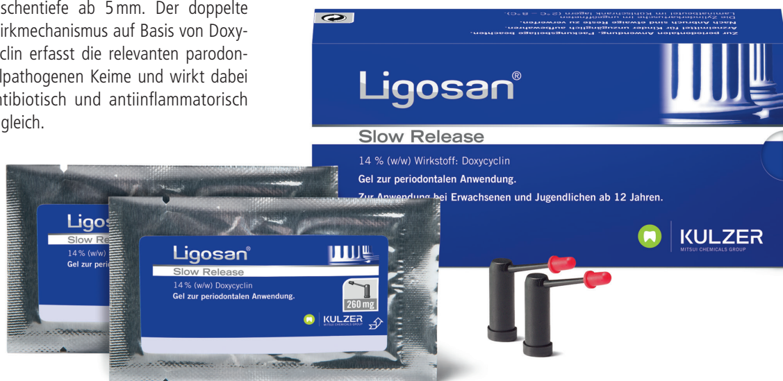
Abb. 1: Das Lokalantibiotikum Ligosan® Slow Release ist seit fast einem Jahrzehnt eine wertvolle Ergänzung in der Reduktion von Taschentiefen bei der Parodontaltherapie.

Im Ergebnis der ergänzenden Therapie mit Ligosan® Slow Release ist nach sechs Monaten eine höhere Re-