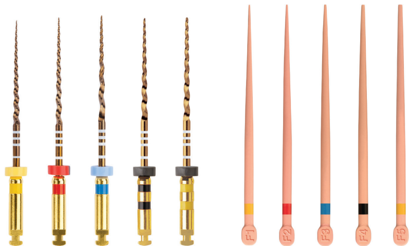
Abb. 1: Für die Praxis ist die farbliche Abstimmung der zueinander passenden Aufbereitungsfeilen, hier z. B. die ProTaper Gold®, und Obturatoren enorm hilfreich.

Beste Voraussetzungen, die in den ersten Schritten geglückte Therapie zu einem guten Ende zu führen, schafft ein aufeinander abgestimmtes System. Aufbereitungsfeilen und Obturatoren müssen zueinander passen, dann gleitet der Obturator in den von Debris und Mikroorganismen befreiten Hohlraum. Für den Behandler kommt es aber noch auf etwas anderes an. Er muss den Therapieerfolg im wahrsten Sinne des Wortes spüren können. Feilen und Obturatoren geben ihm ein taktiles Feed-