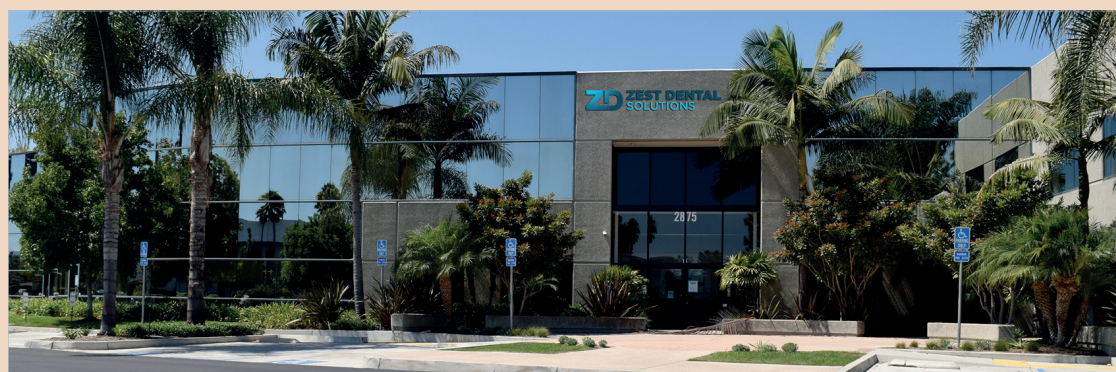
Die Zest Dental Solutions Firmenzentrale in Carlsbad, Kalifornien, USA.