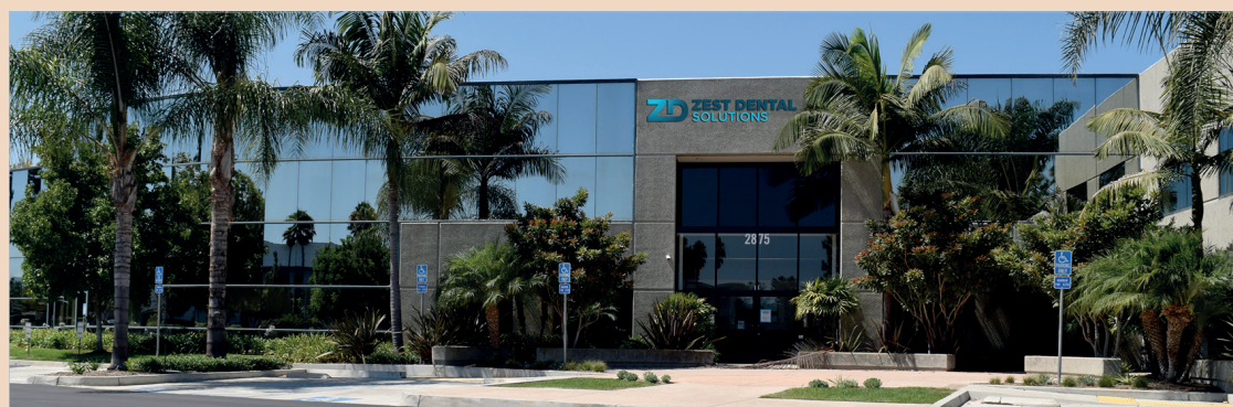
Die Zest Dental Solutions Firmenzentrale in Carlsbad, Kalifornien, USA.