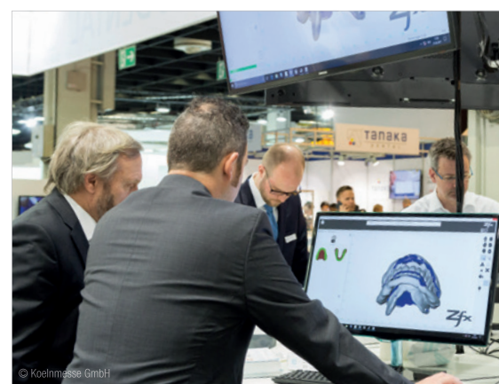
auf der IDS 2017.

Einige Innovationsschwerpunkte liegen im Bereich der digitalen Technologien auf der Hand: Sie haben die Bearbeitung bestimmter Werkstoffe überhaupt erst möglich oder ökonomisch attraktiv gemacht. So können heute unter anderem Kronen- und Brückengerüste aus Zirkonoxid, Lithiumdisilikat, zirkonoxidverstärktem Lithiumsilikat, Feldspat, Hybridkeramik, Hochleistungskunststoffen oder auch goldhaltigen oder edelmetallfreien Legierungen bestehen.