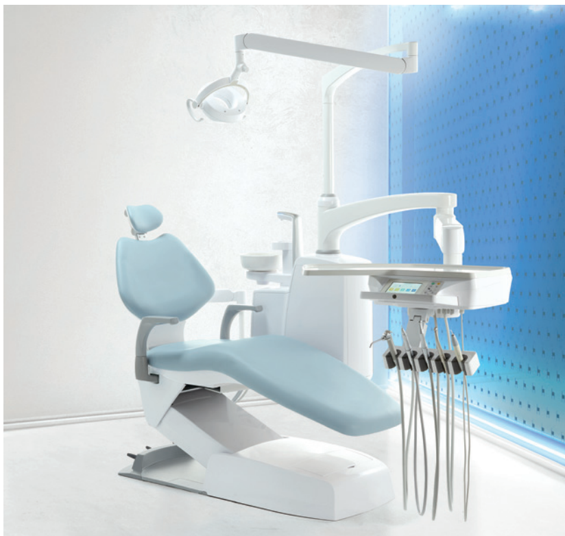
Abb. 1: Die neue Behandlungseinheit EURUS vereint hohe Qualität und außerordentliche Zuverlässigkeit.

Die Behandlungseinheit bildet das Herzstück jeder zahnärztlichen Praxis. Takara Belmont – als globaler Player im Dentalmarkt mit fast 100 Jahren Erfahrung – weiß um diese enorme Bedeutung und ist kontinuierlich bestrebt, durch seine Innovationen die tägliche Arbeit von Behandlern und Assistenz in jeder möglichen