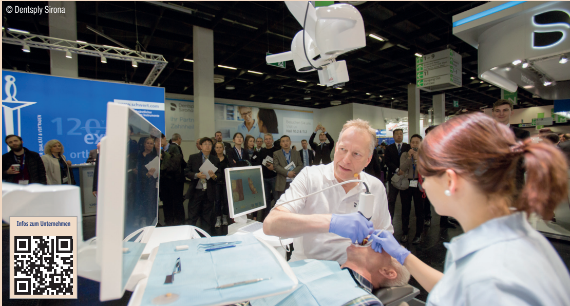
Dentsply Sirona auf der IDS in den Hallen 10.2 und 11.2: Auf zwei Bühnen werden während der gesamten Messezeit pro Tag ca. 20 Live-Behandlungen am Patienten gezeigt.

Interessierte Zahnärzte und Zahntechniker sind vom 12. bis 16. März 2019 herzlich eingeladen, neue Produkte und Technologien von Dentsply Sirona auf der IDS zu erleben und unter fachkundiger Begleitung auszuprobieren. DT