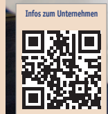
Infos zum Unternehmen

Wer tief in fachliche Themen einsteigen möchte, kann an Hands-