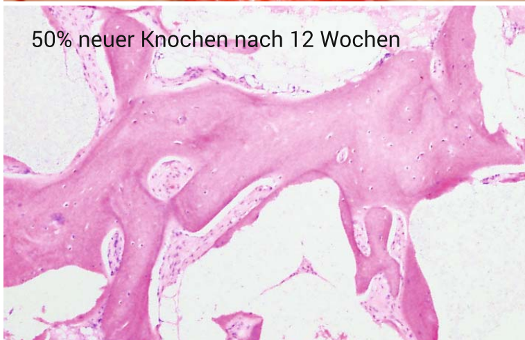
50% neuer Knochen nach 12 Wochen

„Ein Paradigmenwechsel in der Knochenregeneration“