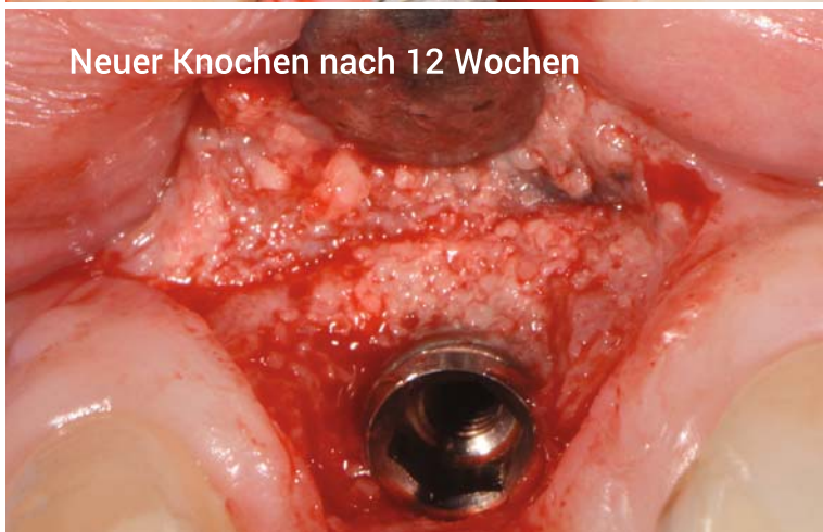
Neuer Knochen nach 12 Wochen