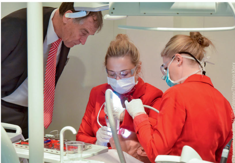
Abb. 1: Handschuhe und Mundschutz als Basismaßnahmen zur Hygiene und Infektionskontrolle sind eine Selbstverständlichkeit auf der Internationalen Dental-Schau.

Praxishygiene mag sich unauffälliger vollziehen als Diagnose, Prophylaxe oder Therapieplanung und wird oft einfach als gegeben vorausgesetzt: Praxishygiene? Läuft! Dabei stellt sie ein eigenständiges Kompetenzfeld dar, erfordert Organisationstalent, Konzentration und Ausdauer.