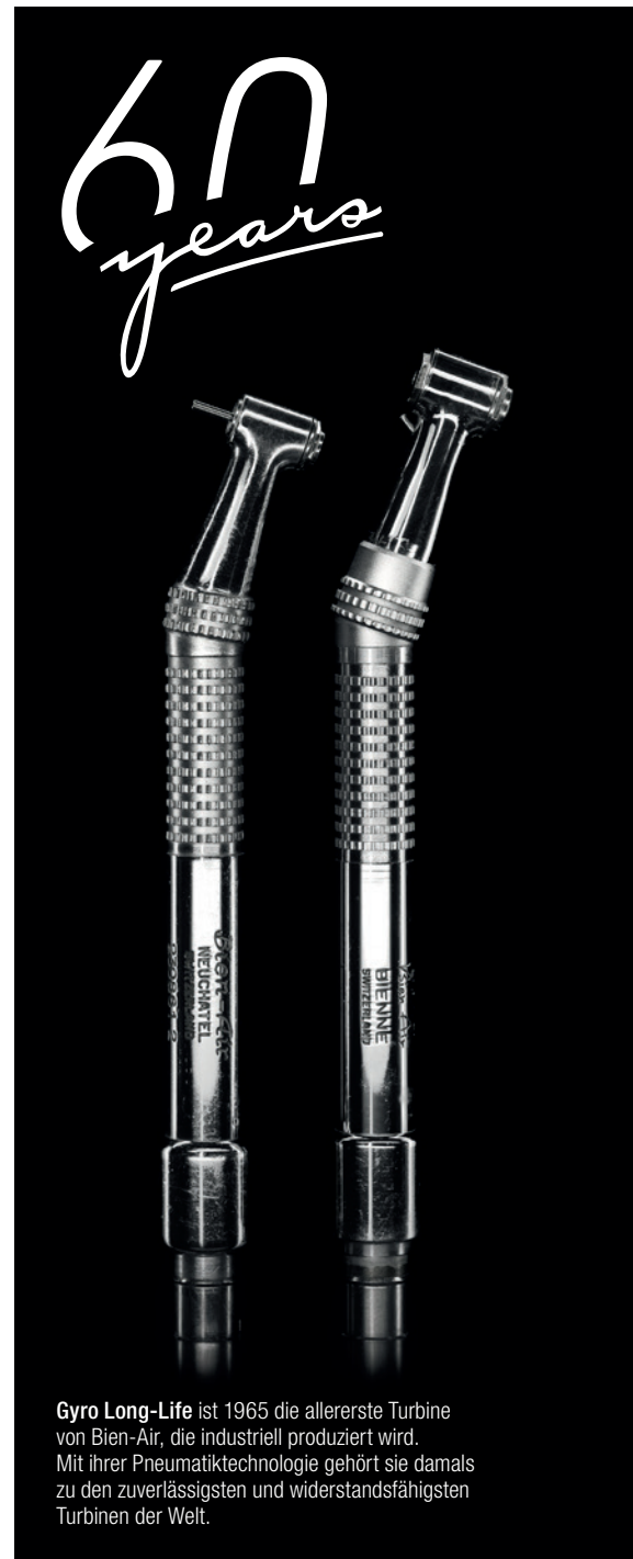
Gyro Long-Life ist 1965 die allererste Turbine von Bien-Air, die industriell produziert wird. Mit ihrer Pneumatiktechnologie gehört sie damals zu den zuverlässigsten und widerstandsfähigsten Turbinen der Welt.