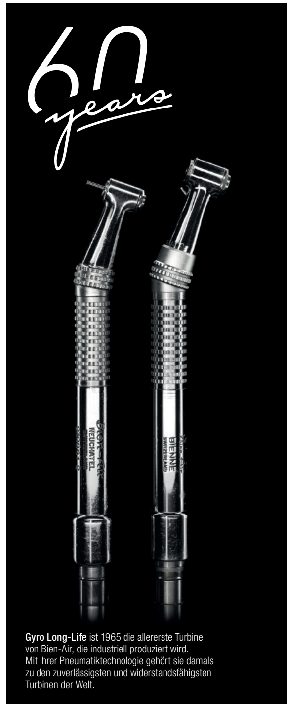
Gyro Long-Life ist 1965 die allererste Turbine von Bien-Air, die industriell produziert wird. Mit ihrer Pneumatiktechnologie gehört sie damals zu den zuverlässigsten und widerstandsfähigsten Turbinen der Welt.