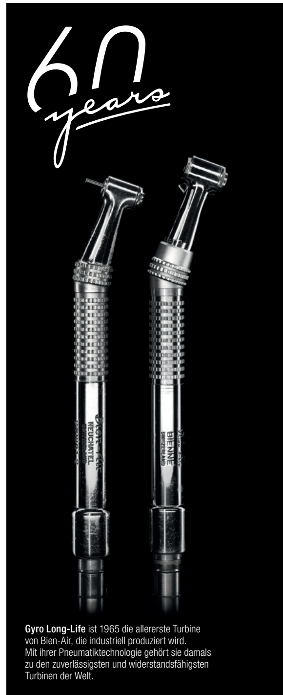
Gyro Long-Life ist 1965 die allererste Turbine von Bien-Air, die industriell produziert wird. Mit ihrer Pneumatiktechnologie gehört sie damals zu den zuverlässigsten und widerstandsfähigsten Turbinen der Welt.