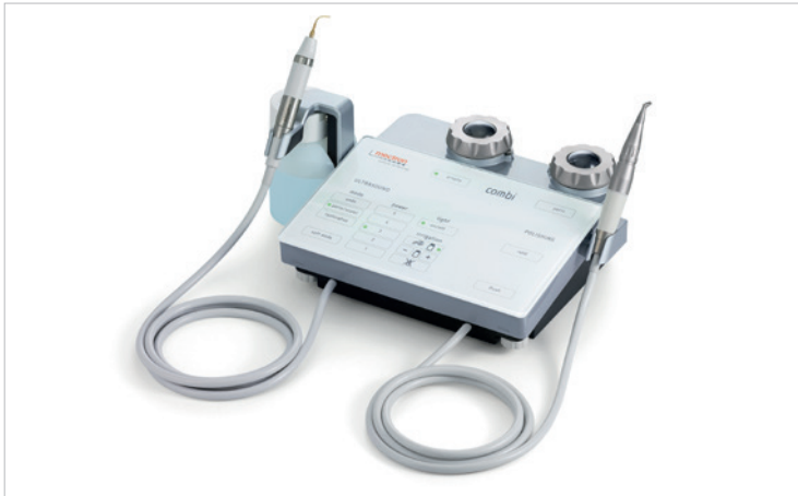
Combi touch – Ultraschalleinheit und Pulverstrahlgerät in einem.

mectron mit starker Prophylaxe-Linie auf der IDS 2019.