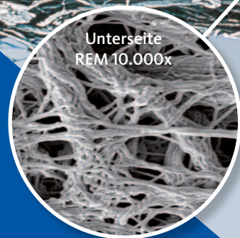
Unterseite REM 10.000x