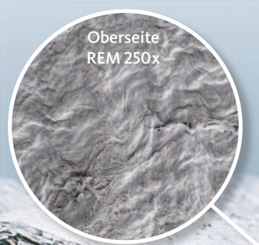
Oberseite REM 250x