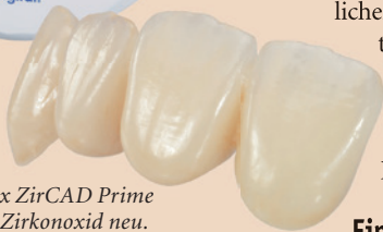
IPS e.max ZirCAD Prime definiert Zirkonoxid neu.

Zirkonoxid-Portfolio des erfolgreichen und meistverkauften Vollkeramiksystems der Welt. Die Gradient Technology (GT) ist das Herzstück des neuen Materials. Sie vereint drei innovative Prozesstechnologien in einem Produkt. Eine ausgeklügelte Pulverkonditionierung der Rohstoffe 5Y-TZP und 3Y-TZP, eine innovative Fülltechnologie und eine hochwertige Nachvergütung ermöglichen passgenaue sowie hochästhetische Ergebnisse. Daraus resultieren unter anderem auch schnellere Sinterzyklen, z.B. von 2h 26 min für Einzelzahnkronen im Programmat S1 1600.