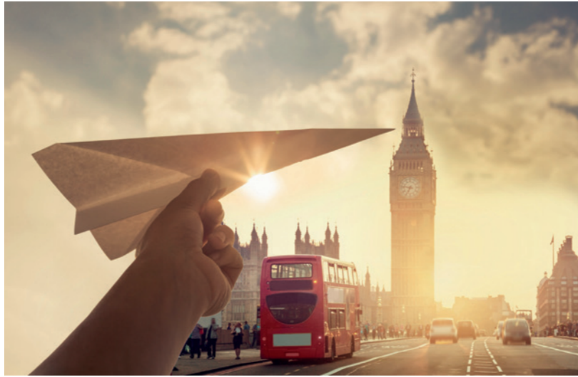
Abb. 1: Ein voller Erfolg – Excellere 2018 in Madrid. Abb. 2: Die Registrierung für Excellere 2019 in London ist unter www.3mexcellere.com ab sofort möglich!

Eine chinesische Weisheit besagt: „Wenn der Wind des Wandels weht, bauen die einen Schutzmauern und die anderen Windmühlen“. Zu Letzteren gehören die Referenten des 3M-Kongresses „Excellere 2019“, der am 17. und 18. Mai 2019 in London stattfindet. Basierend auf eigenen Erfahrungen berichten sie, wie es gelingen kann, den Wandel in der Kieferorthopädie zum eigenen Vorteil zu nutzen. Die Anmeldung zum Kongress ist on-