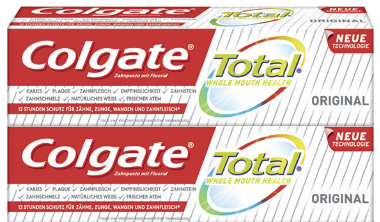
Die neue Colgate Total® Zahnpasta.

Die neue Colgate Total® ist eine Multi-Benefit-Zahnpasta mit einer umfassenden Palette an Vorteilen, darunter Schutz vor Plaque und Gingivitis, Karies, Dentinhypersensibilität, Säuren aus Lebensmitteln, Verfärbungen, Zahnstein und Halitosis. Neben der innovativen Formel aus dualem Zink und Arginin enthält Colgate Total® 1.450 ppm Fluorid. Für mundgesunde Patienten, bei denen keine besonderen therapeutischen Maßnahmen angezeigt sind, ist die neue fluoridhaltige Zahnpasta daher der ideale, zweimal tägliche Begleiter.